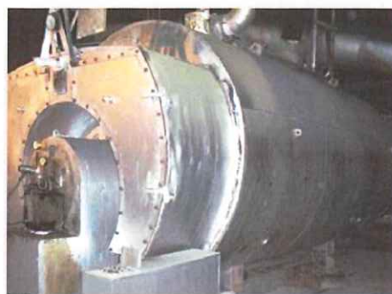
ボイラーの保温材

本年は、同法改正における工作物の事前調査や、石綿分析方法などについて講演を行います。