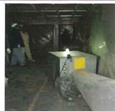
隔離養生区画内(除去作業前)

石綿を含有する建築材料を使用した建築物等の解体等工事では、負圧隔離養生、集じん機の使用等の作業基準等を遵守し、石綿飛散防止対策を適切に実施する必要があります。